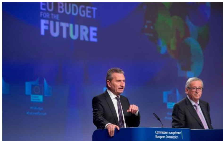
Den tyske kommissær med ansvar for budgettet Günther Oettinger (til venstre) og kommissionsformand Jean-Claude Juncker præsenterer deres syn på EU's budget.