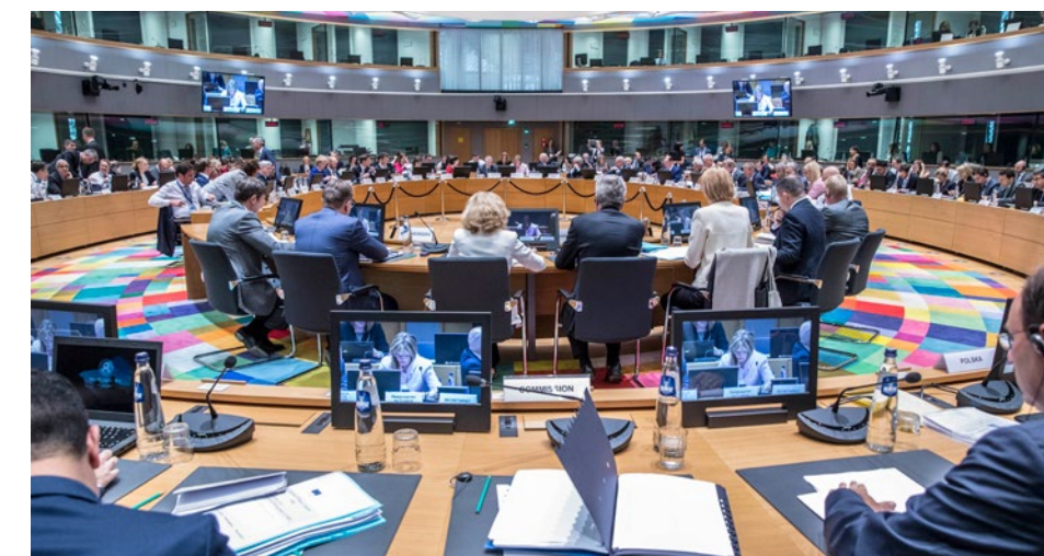
Ministre fra EU-landene drøfter EU's budget.

Storbritannien, Tyskland, Holland, Sverige, Østrig og Danmark.